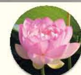
ミセス・スローカム 4・10